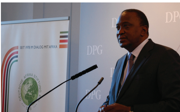
Alter und neuer Präsident Uhuru Kenyatta

In Relation zu den zuvor geschürten Ängsten ist das Ausmaß der Gewalt zwar noch gering, die Gefahr einer Eskalation jedoch bei Weitem noch nicht gebannt. Die weitere Vorgehensweise der Opposition sowie der Umgang mit den Verlierern der Wahl seitens der Regierung wird bestimmen, inwieweit sich die momentane fragile Ruhe stabilisiert.