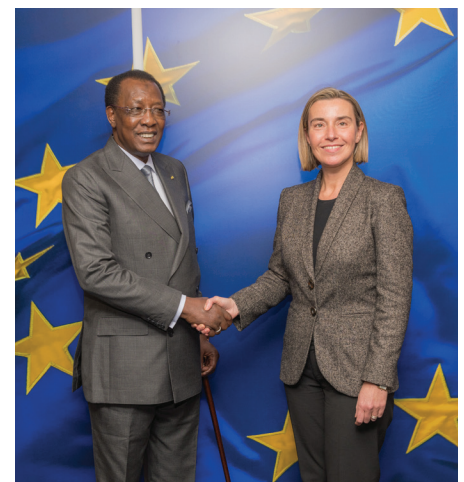
Präsident Idriss Déby mit EU-Außenbeauftragter Federica Mogherini

interpretiert werden. Vor allem Präsident Déby machte klar, dass er gegen diese Zentren ist. Während Macron in ihnen „ein pädagogisches Instrument“ zur Entmutigung von den sogenannten Wirtschaftsmigranten sieht, befürchtet Déby, dass diese wie ein Aufruf an alle Migrationswillige wirke, sich dorthin zu begeben. Zunächst müsse die EU ihnen in der Bewältigung der bereits aufgenommenen Migranten finanziell zur Seite springen. In einem Interview im Umfeld des Gipfels sprach sich sein Außenminister Hissein Brahim Taha für ein Abkommen mit der EU über die Umsiedlung von bereits vom UNHCR (Flüchtlingshochkommissariat der